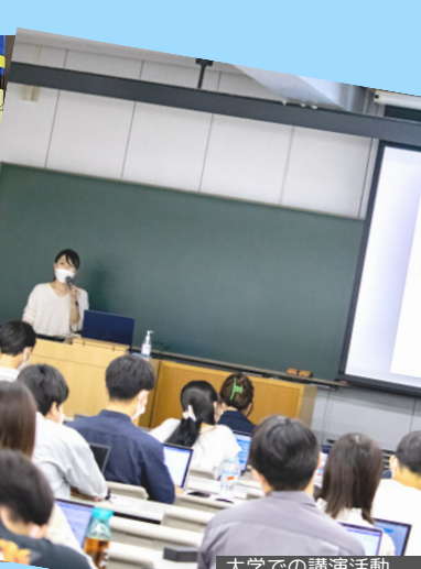
大学での講演活動