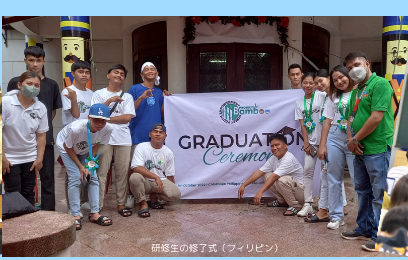
研修生の修了式 (フィリピン)