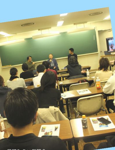
日韓みらい学習会