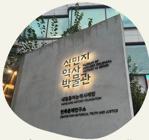
植民地歴史博物館