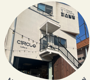
NARPI@ピースビルディング